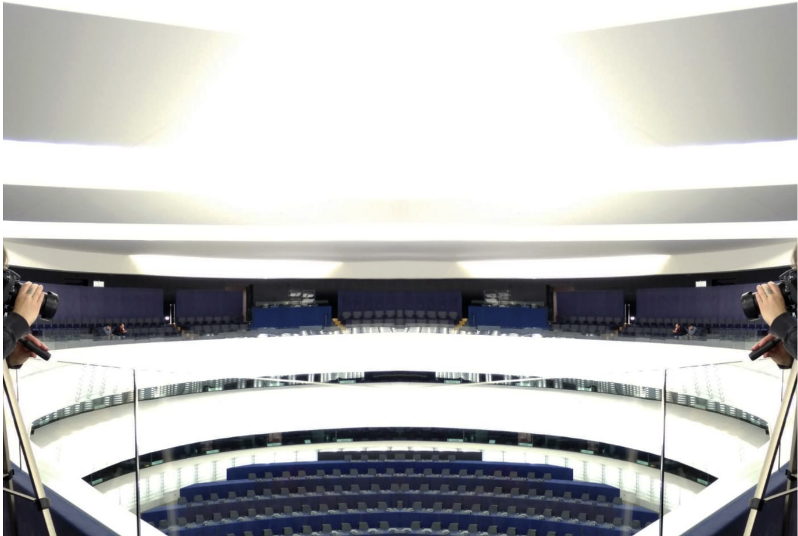
Vom Versuch, den Europäischen Traum einzufangen | Trying to capture the European Dream