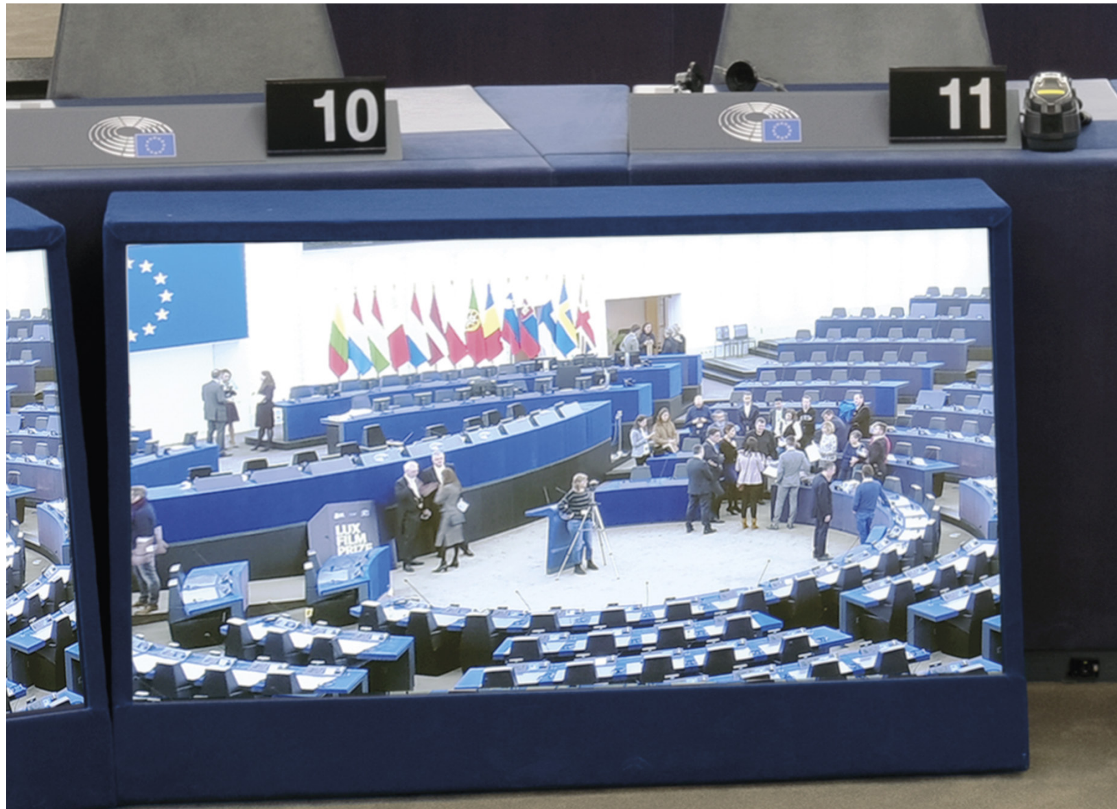
Abb. Seite | Fig. Page

1: Ausstellungsansicht | Exhibition View: Europäische Kulturhauptstadt Chemnitz, KOSMOS Festival für Demokratie 2025, Hartmannfabrik